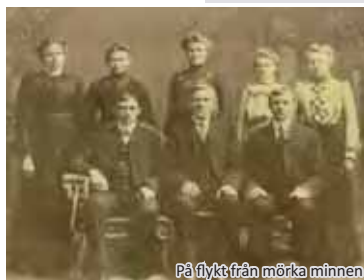
På flykt från mörka minnen