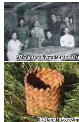
Släkten som flyttade från hålan