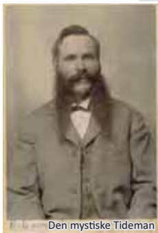
Den mystiske Tiderman