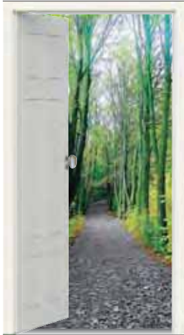
Omslagsbild skapad av Cheetah Bengtsson

Olofströmsbygden har länge präglats av att många flyttat hit men också av att många flyttat bort. Men oavsett om det varit en flykt eller en flytt så har alla gjort avtryck och satt spår. Årets tema för Näselfrossa / flyktens spår kan knappast bli mera aktuellt än nu. Ordet flykt kan ges många tolkningar. Historien över århundraden berättar om människans ständiga förflyttning. Många har tvingats fly - andra har flyttat frivilligt med hopp eller förvisning om att komma till något bättre.