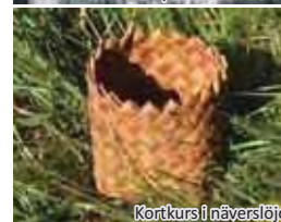
Kortkurs i näverslöd