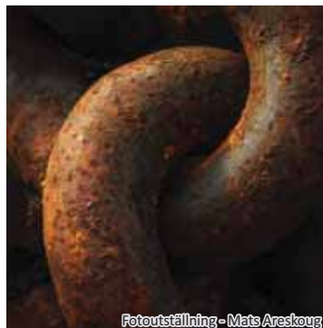
Fotoutställning - Mats Areskoug