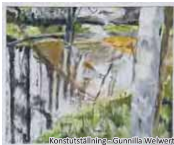
Konstutställning - Gunnilla Welwert