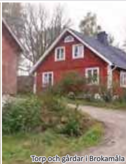
Torp och gårdar i Brokamåla