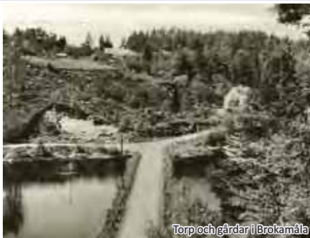
Torp och gårdar i Brokamåla