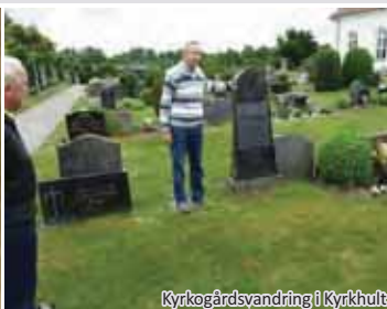
Kyrkogårdsvandring i Kyrkhult